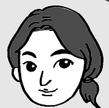
イラスト協力：加藤舞美

いよいよ新年度。そしてあと一か月もすると「平成」が終わり、新元号…。次の時代はどんなものになるのでしょうか？ 見るもの、聴くもの、感じるもの、いろいろなものが新しくなったり、環境が変わったり。いろいろな刺激を受けながらも、これからもマイペースに成長していきたいなあ、と思う今日この頃です。